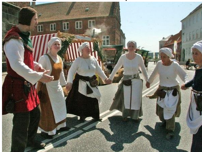
Kædedans på fødevarermarkedet.

Især middelaldermusikgruppenene Krapyl og Ramasjang havde vi et super samarbejde med. Det udløste nogle rigtig fantastiske optrin og opvisninger. Bl.a. havde vi en lang kædedanssekvens med middelaldermusikgruppen Ramasjang på borgområdet med mange begejstrede publikummer som deltog i kæden og adskillige andre der kikkede på.