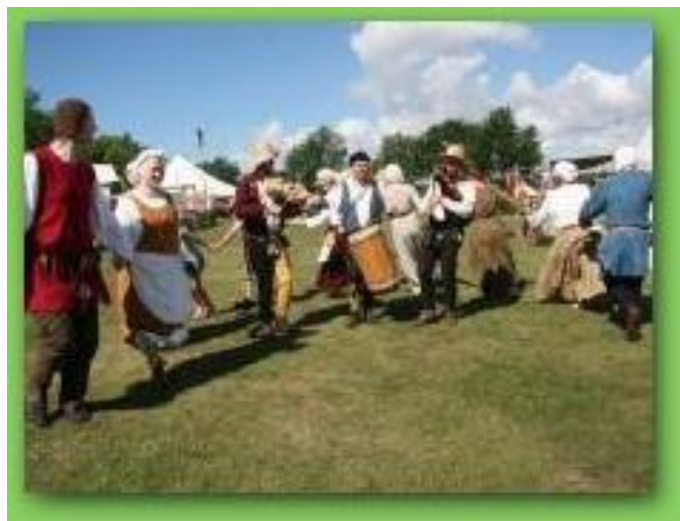
Kædedans med middelaldermusikgruppen Pøbel.

Nysted Middelalder Festival kalder sig med rette for Danmarks smukkeste Middelalderfestival, da den ligger i meget smukke omgivelser på en plæne omkranset af træer nær Nysted Havn. Selv vejrguderne var på Nysteds side med 32 grader søndag og 26 grader lørdag.